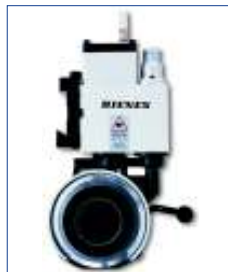
Messerhalter PSGs DF