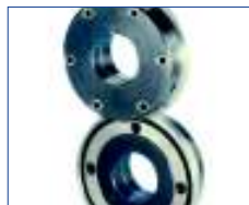
Messer mit Muffen