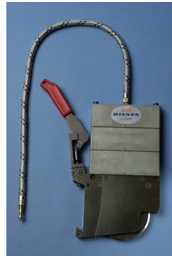
DIENES Messerhalter PQD-MC-3