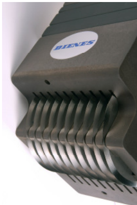
Mini Cut für Schnittbreiten ab 4 mm